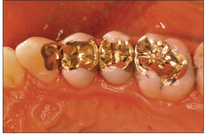
Variationen in Gold: 23 Slotinlay, 24 invisibel Onlay, 25 mod Goldinlay, 26 mo Goldinlay.

deren Einstellung zur Mundhygiene stimmt, und dort, wo man durch konservatives Vorgehen ein starkes Sichtbarwerden des Metalls vermeiden kann!